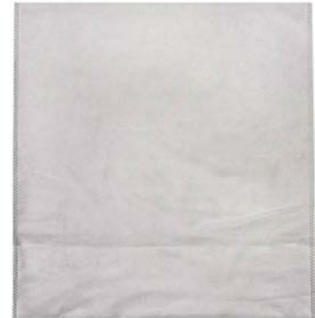
RTEKB + RTEKBB, Abb. weiß